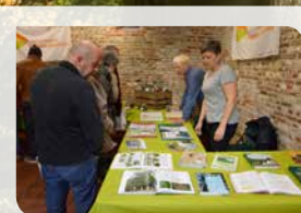
Puur lokaal! Sappig dichtbij p. 3