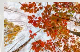
Boomplantactie p. 9