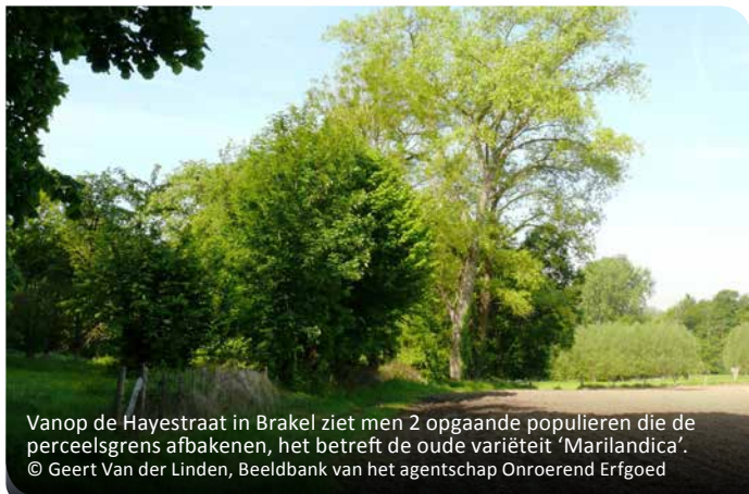
Vanop de Hayestraat in Brakel ziet men 2 opgaande populieren die de perceelsgrens afbakenen, het betreft de oude variëteit 'Marilandica'.