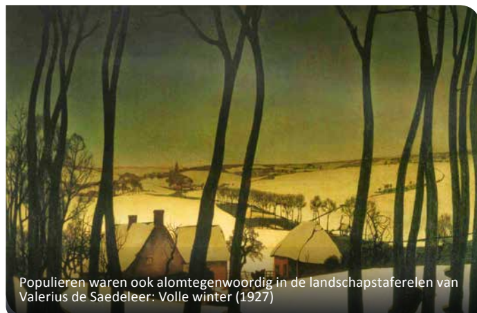
Populieren waren ook alomtegenwoordig in de landschapstaferelen van Valerius de Saedeleer: Volle winter (1927)

Sinds het einde van de 18de eeuw komen er in het cultuurlandschap van de Vlaamse Ardennen verschillende oude populierenvariëteiten voor. Deze bomen worden gekenmerkt door een diep gegroefde schors en karakteristieke gebogen stammen. De laatste decennia zijn er echter heel wat oude populieren verdwenen en vaak werden zij niet terug aangeplant. Soms lag dat aan een slechte standplaats: te nat of te droog. Vaker was de standplaats wel geschikt, maar werden ze vervangen door andere boomsoorten of werden er helemaal geen nieuwe bomen aangeplant. De achteruitgang van deze oude populierenvariëteiten is een jammere evolutie, want zij hebben een hoge landschapswaarde en belangrijke ecologische meerwaarde.