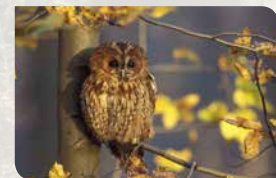
Uit tips p. 22